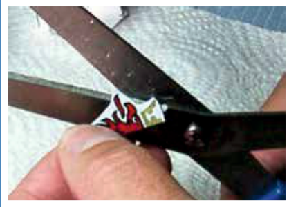
1. Decal möglichst genau zuschneiden