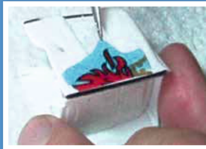
5. Decal aufbringen und richtig positionieren