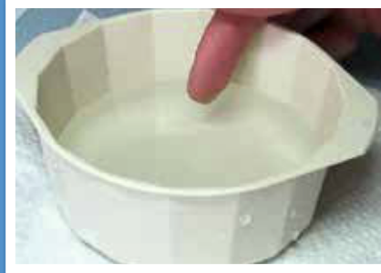
2. Finger leicht befeuchten