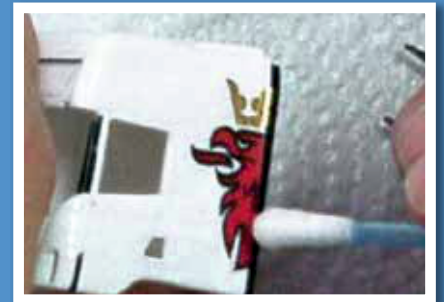
6. Decal mittels Wattestäbchen trockentupfen und in Folge trocknen lassen